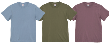
2021SSから新たに登場した期間限定色の「リミテッドカラー(全3色)」

「みんなでおそろいのTシャツを作りたい」店舗スタッフのユニフォームにといった需要には、カラバリの豊富さで答えます。コーポレート・スクールカラーにも答えられる54カラーのラインアップにはきっとお探しのカラーがあるはずです。