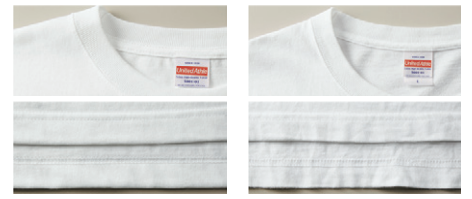
未着用の5001-01(左)と、1年間着用した5001-01(右)

5.0~7.0オンスが一般的に「ヘヴィーウェイト」とよばれる生地厚で、「5.6オンス」は一枚で着用できるちょうど良い生地感と強度を兼ね備えています。丈夫で長く着用できるので、洗濯を繰り返してもへこたれません！